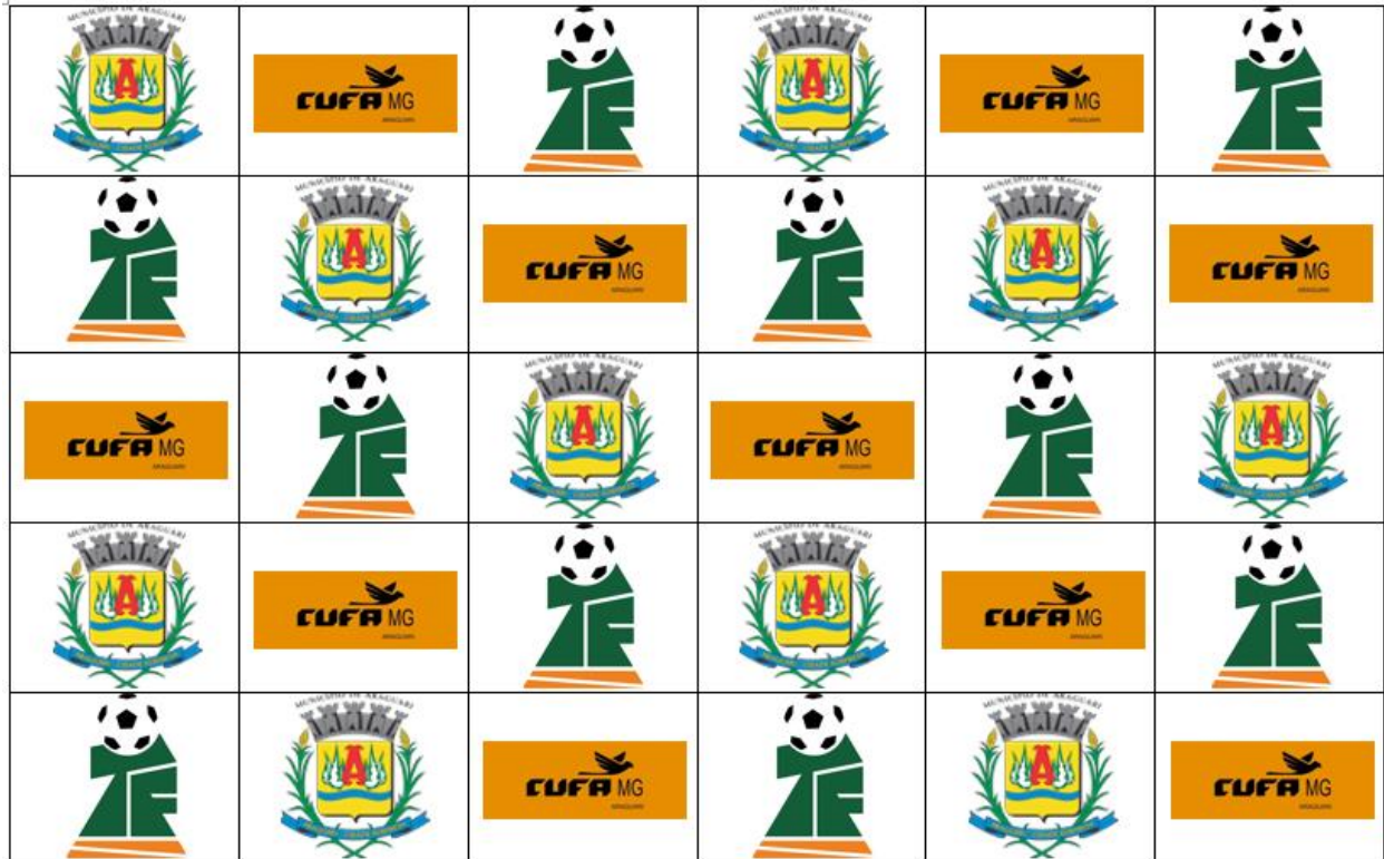
MODELO DE BRACKDROP TAÇA DAS FAVELAS