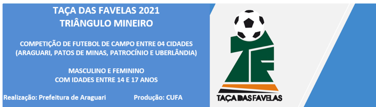
MODELO DE FAIXA PARA TORNEIO TAÇA DAS FAVELAS