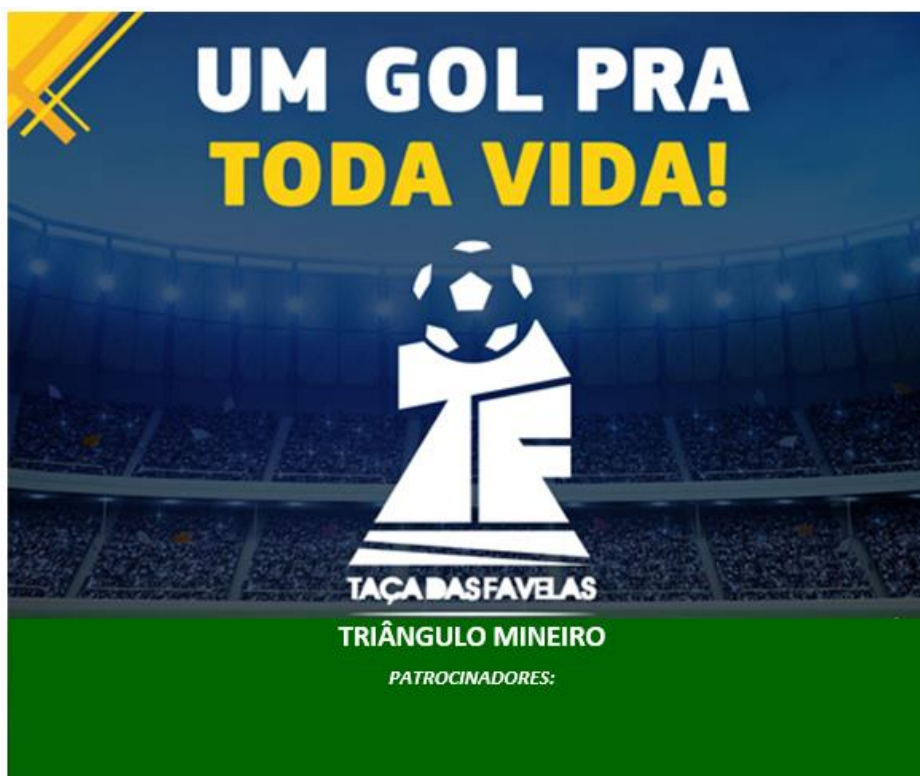
MODELO DE PANFLETO (IMPRESSÃO DIGITAL)