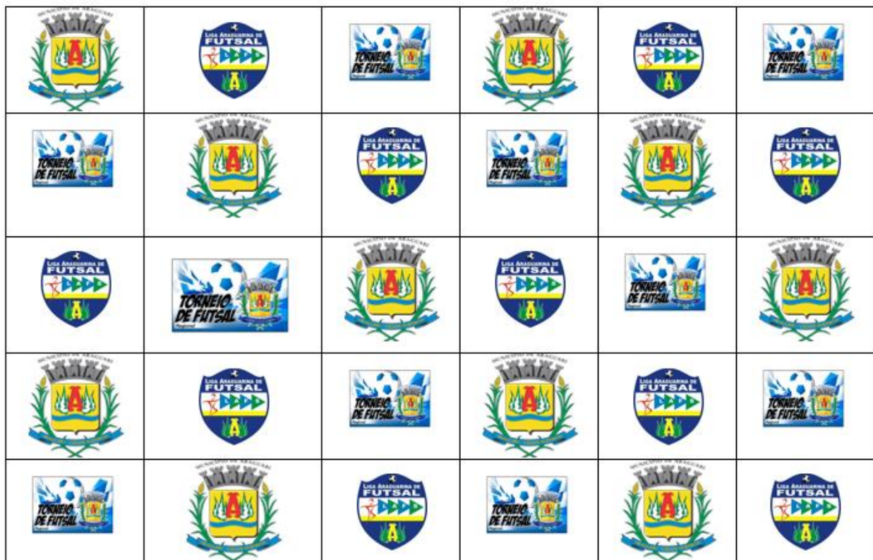
MODELO DE BRACKDROP TORNEIO REGIONAL DE FUTSAL