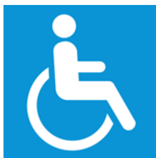
Figura 1 - Símbolo internacional de acesso

Os rebaixamentos de guias para acessibilidade nas esquinas serão realizados de acordo com o estabelecido em norma específica (NBR 9050:2020) e posicionados de acordo com o Projeto. As rampas serão executadas em piso cimentado e devem pintadas com o símbolo internacional de acesso – SIA, que consiste em um pictograma branco sobre fundo azul (referência Munsell 10B5/10 ou Pantone 2925 C), conforme Figura 1.