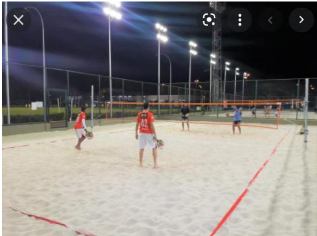
Quadra de Beach Tênis com areia lavada fina (branca) - AB 50 ou 65 70