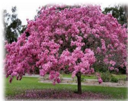
Imagem 2. Ipê rosa (ilustrativa)

De acordo com especificações do projeto deverá ser realizado o plantio de árvores da espécie ipê na cor rosa (nome científico: Handroanthus avellandae ) e ipê na cor amarelo (nome científico: Chrysotrichus ). O quadro quantitativo e os locais que serão instaladas constam no projeto arquitetônico. Ver imagens 2 e 3.