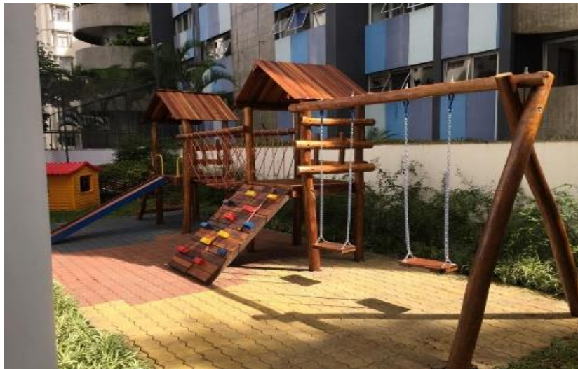
Imagem 8. Casinha do Tarzan (ilustrativa)

uma maior durabilidade, resistência às intempéries e vida útil prolongada, o que possibilita a instalação em áreas abertas e com exposição ao ar livre. Deverá ser respeitada as seguintes dimensões específicas: 7,00 m x 3,50 m com altura de 3,20 m do piso. A altura do piso da torre 1,20 m. A casinha do Tarzan deverá ser composta por: duas plataformas com cobertura, balanço duplo acoplado, escorregador, ponte de 2m, escalada de corda e escada de acesso. Ver imagem 8.