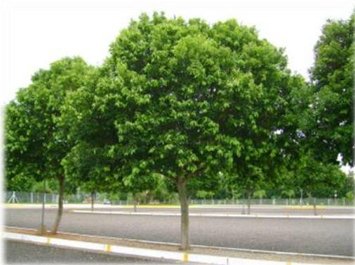
Imagem 6. Oiti (ilustrativa)