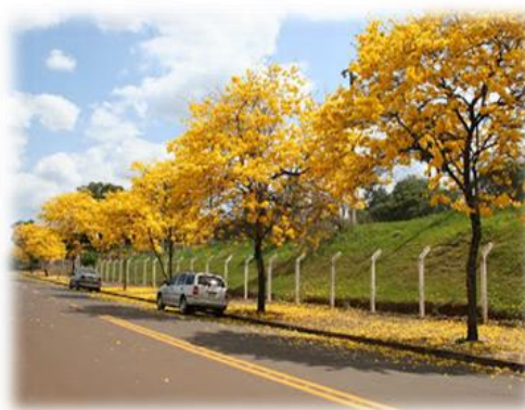
Imagem 3. Ipê amarelo (ilustrativa)