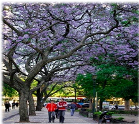
Imagem 4. Jacarandá (ilustrativa)

Além disso, conforme projeto arquitetônico ainda são previstos o plantio de Oiti (nome científico: Licania Tomentosa ), Palmeira Licuri (nome científico: Syagros Coronata ), Jacarandá (nome científico: jacarandá cuspidifolia ) e Pequi (nome científico: Cayocar brasiliense ). O quadro quantitativo, o porte e demais especificações encontram-se previstos em projeto. As mudas a serem plantadas deverão ter no mínimo 1,50 m de altura. Ver imagens 4, 5, 6 e 7.