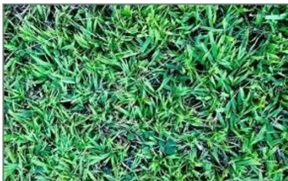
Imagem 1. Grama batatais (ilustrativa)

grama, é preciso fazer a compactação da grama com um maço de peso mínimo de 5 Kg, para uma fixação melhor da grama no solo novo. Toda a grama deverá ser irrigada diariamente, sempre no primeiro e no último horário do dia, pois são os horários que apresentam temperaturas ideais para a irrigação. Dias que tiverem chuvas constantes não será necessária essa irrigação. Ver imagem 1.