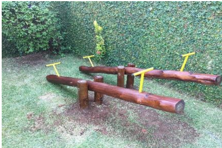
Imagem 10. Modelo de gangorra (ilustrativa)

A gangorra dupla deverá ser executada em tronco de eucalipto tratado em autoclave de 2,50 m x 1,00 m. Ver imagem 10.