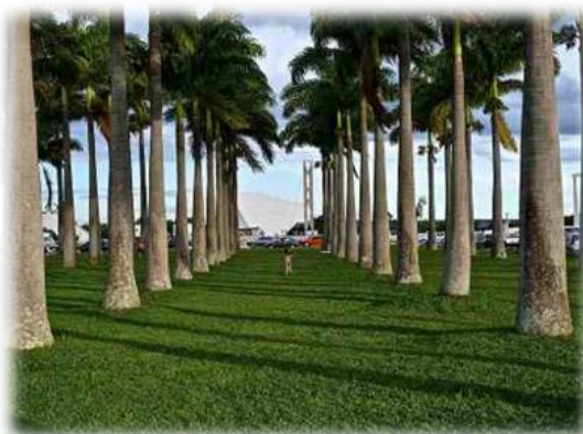
Imagem 5. Palmeira Licuri (ilustrativa)