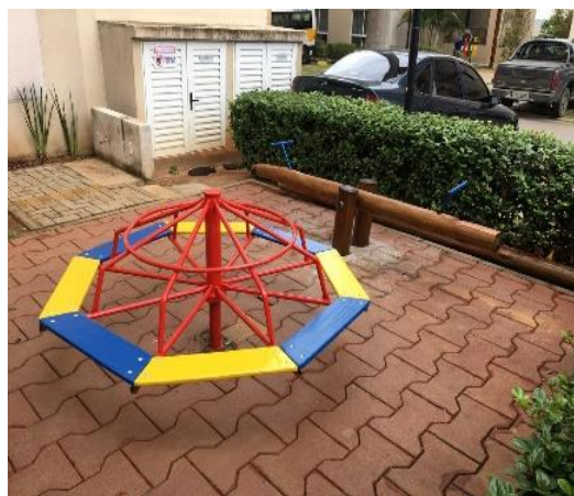
Imagem 9. Modelo de gira-gira (ilustrativa)

O gira-gira será executado em tubos de aço com 8 assentos de madeira colorido com 1,50 m de diâmetro. Ver imagem 9.