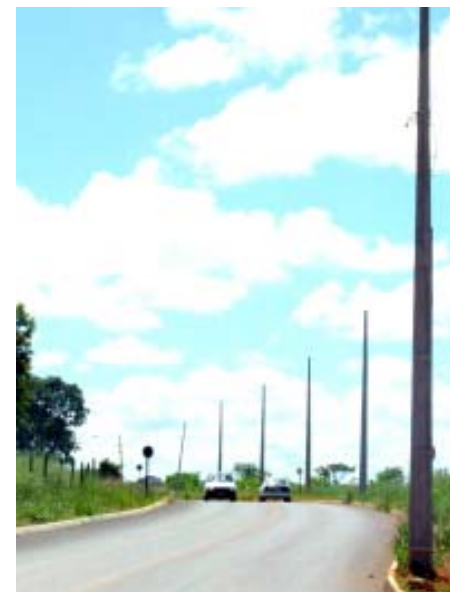
Depois do Asfalto, Prefeitura ilumina via para oferecer mais segurança aos usuários.

A iluminação da Rua Maria Borella Pelegrine faz parte do Plano de Ação da Prefeitura de Araguari, que prevê investimentos de R$1 milhão para 2011.