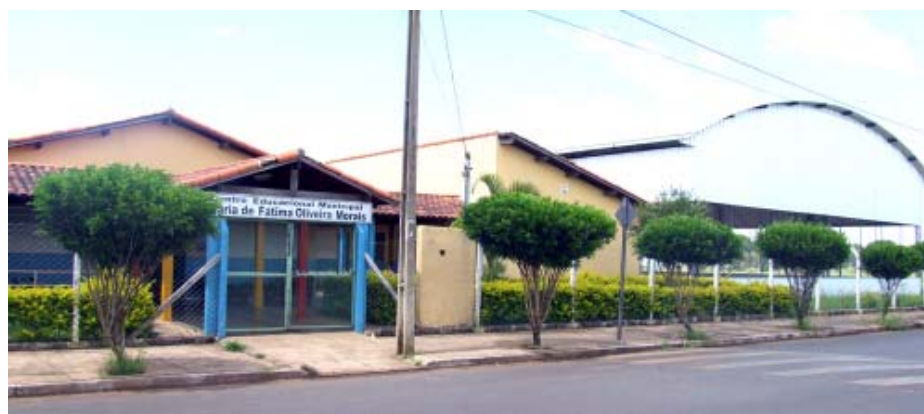
Escola se tornou referência em cultura e educação

O curso de artesanato será aberto à toda população e oferecido inteiramente de graça. As aulas serão ministradas pela instrutora Zélia Troncha. Durante o curso serão utilizados materiais recicláveis na confecção de cestas, bonecas, pinturas, etc. Futuramente os trabalhos produzidos