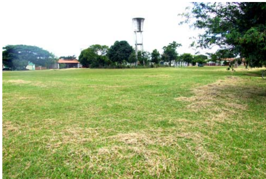
Praça receberá nova iluminação