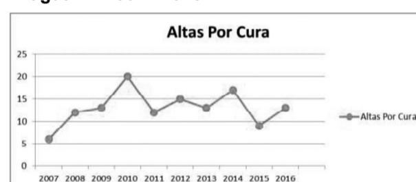
Gráfico 2: Altas por cura da Tuberculose – Araguari - 2007 - 2016.

Fonte: SINAN – Secretaria Municipal de Saúde de Araguari.