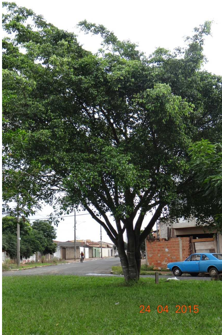
Figura 04: Vista geral do segundo individuo arbóreo a ser retirado na Praça, para que possa realizar as obras.