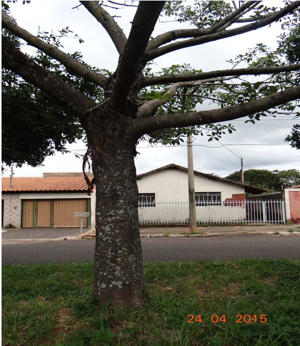
Figura 01: Vista geral do indivíduo da espécie gameleira, que deverá ser retirada, pois esta em local inadequado.