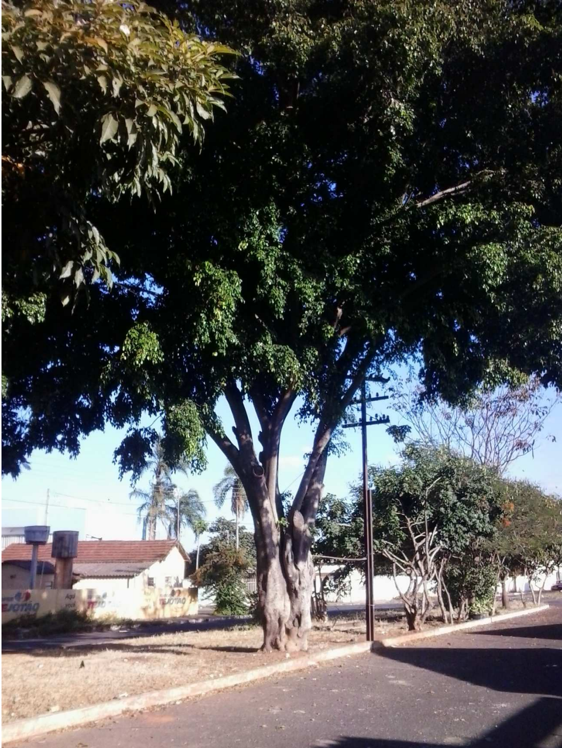
Figura 02: Indivíduo arbóreo que está invadindo a rede de esgoto da residência localizado na rua Jaime de Araújo, em frente ao número 11.