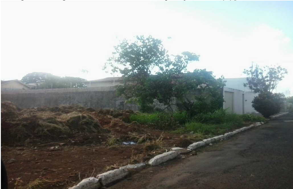
Figura 02: Imagem do indivíduo arbóreo da espécie pata de vaca ( Bauhinia variegata ).