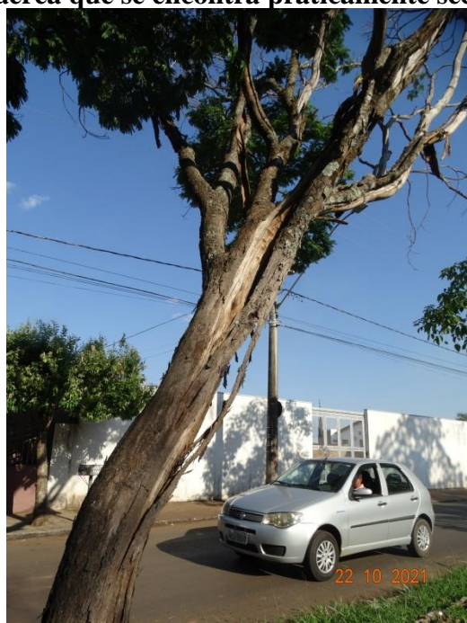
Figura 01 e 02 – Indivíduo da espécie sibipiruna demonstrando imagem 1 declividade para o canteiro central e via pública, perda da casca. Imagem 2 – comprometimento da parte aérea que se encontra praticamente seca.