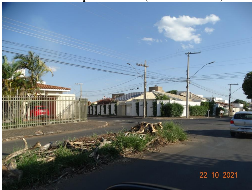
Figura 05 – Imagem geral do canteiro da Av. Hugo Alessi demonstrando espécie com galhos encostando no chão e que deverão ser podadas.