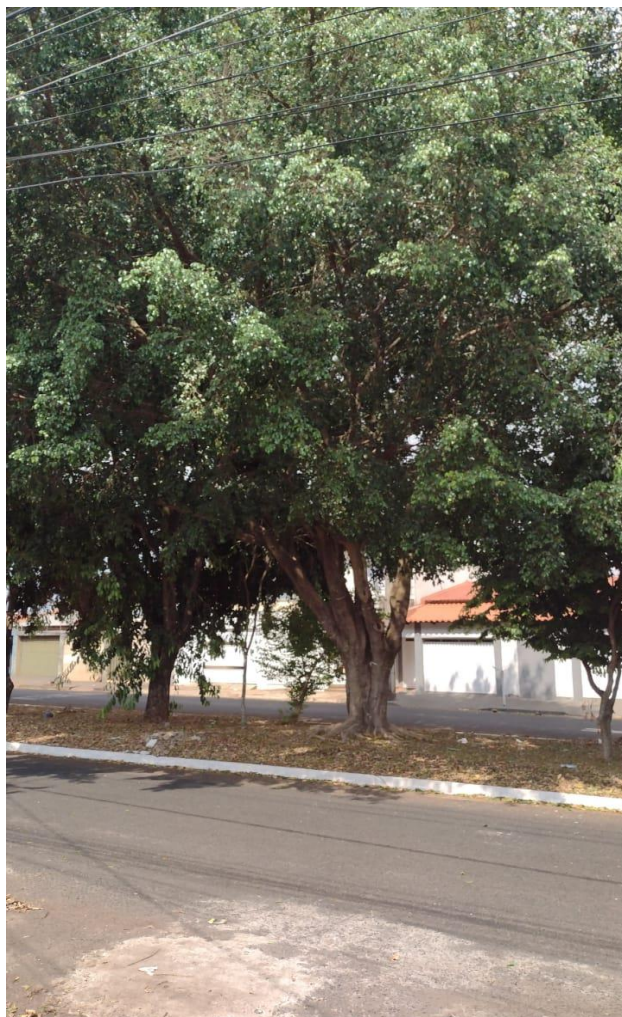
Imagem 04 - individuo para supressão, em frente ao n°1110.