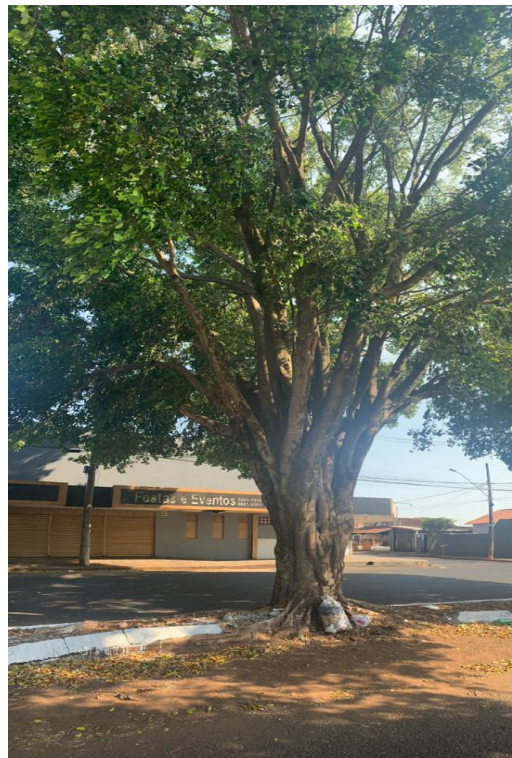
Imagem 02 - individuo para supressão. em frente ao nº138.