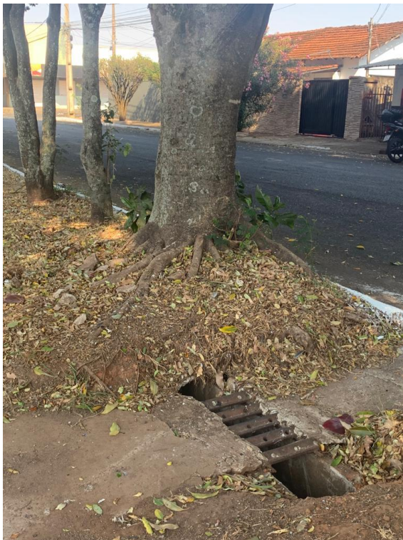
Imagem 01-individuo para supressão, em frente ao nº50.