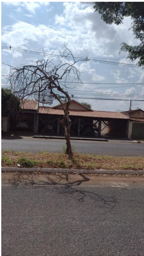
Imagem 03 - individuo morto para supressão, em frente ao n°438.