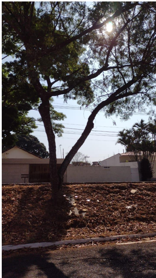
Imagem 04 – 01 Individuo Frente ao n° 1464