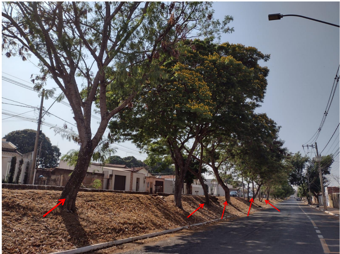
Imagens 01 - Visão geral dos cinco indivíduos a serem suprimidos.