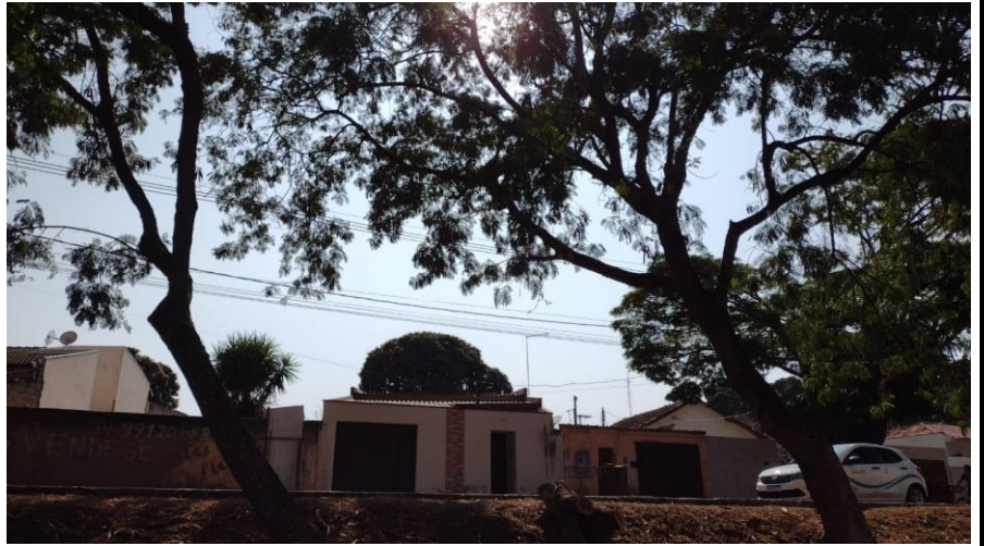
Imagem 03 – 02 indivíduos Frente ao n° 1480