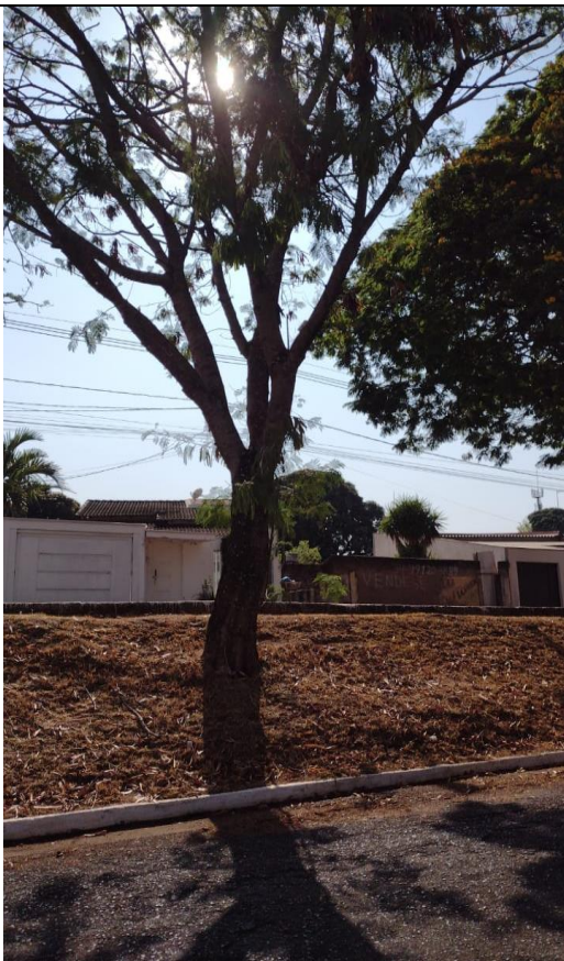
Imagem 02 – 01 Individuo Frente ao n° 1420