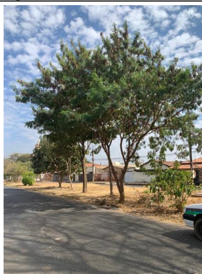
Figura 2: Leucena em frente o número 689.