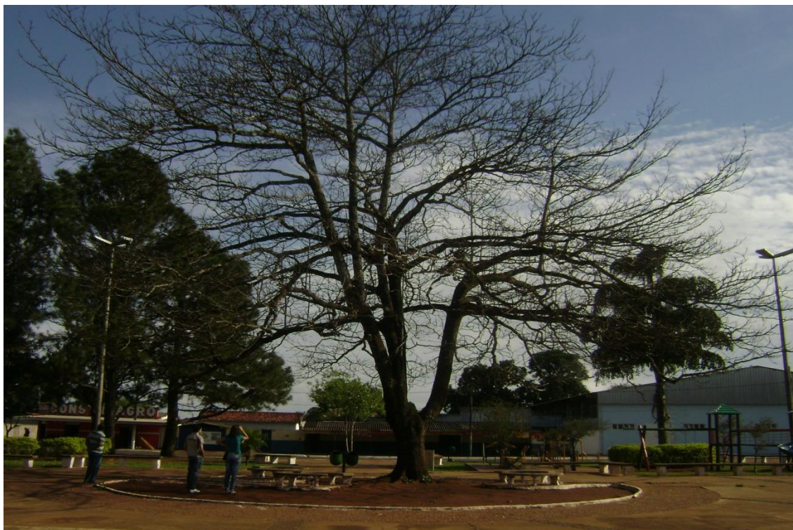
Figura 01: Vista geral do individuo arbóreo localizado na Praça Nossa Senhora Aparecida Distrito de Amanhece.