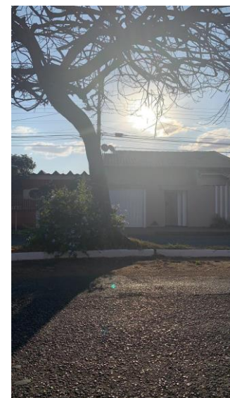
Flamboyant em frente ao nº 1661