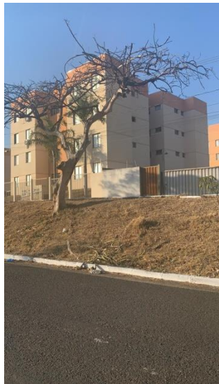
Flamboyant em frente ao nº1390