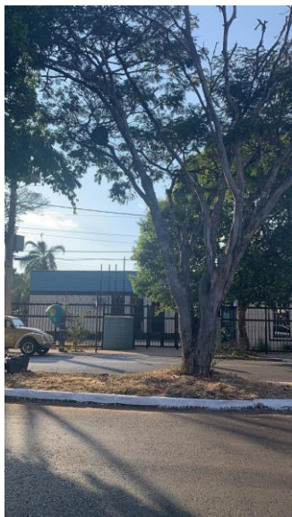
Sibipiruna em frente Vara do trabalho