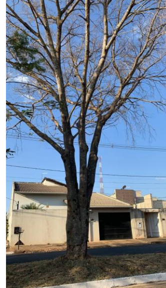
Ficus em frente ao nº 2452