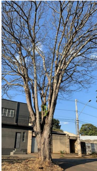
Sibipiruna em frente ao nº 1635