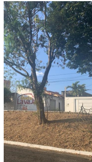
Leucena em frente ao nº1420