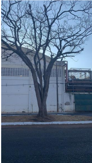
Sibipiruna fundo ebba