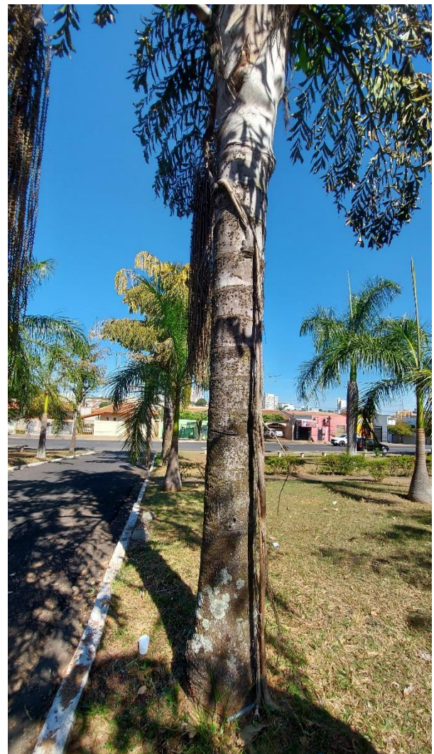
Foto 02 e 03: Palmeiras na Praça do Rosário que necessitam passar por procedimentos de poda e retirada de Figueiras “Mata Pau” que estão parasitando-as