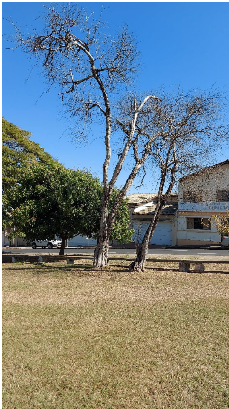
Foto 08: Duas árvores mortas na Praça do Rosário, que necessitam ser retiradas