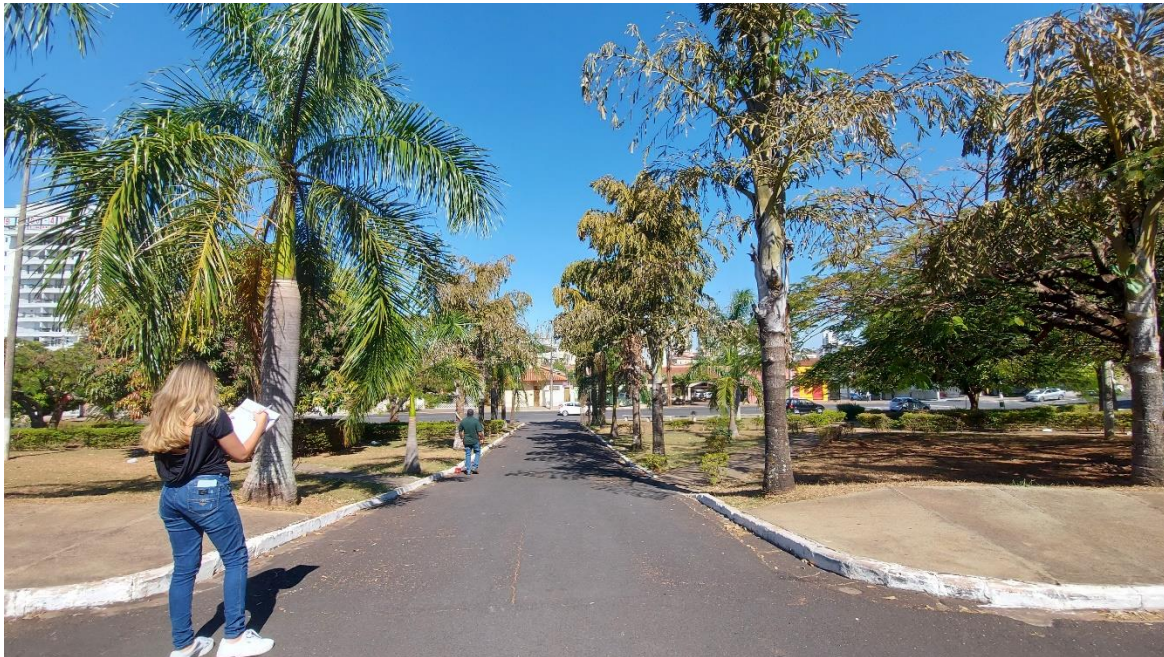
Foto 01: Vista geral do “Caminho das Palmeiras” na Praça do Rosário – recomendações de podas higiênicas nas mesmas