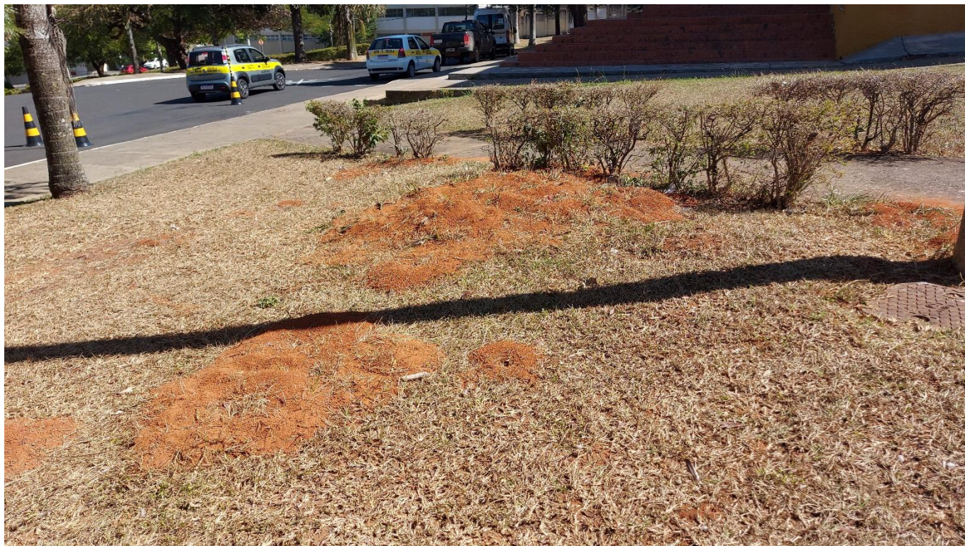
Foto 07: Evidência de formigueiros na Praça do Rosário, que necessitam ser combatidos antes da realização de novos plantios no logradouro