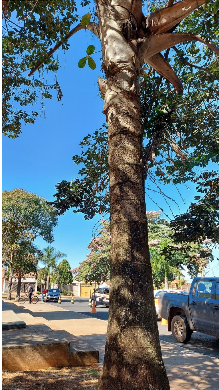
Foto 09: Palmeira em declínio em rua interna da Praça do Rosário, que necessita ser suprimida