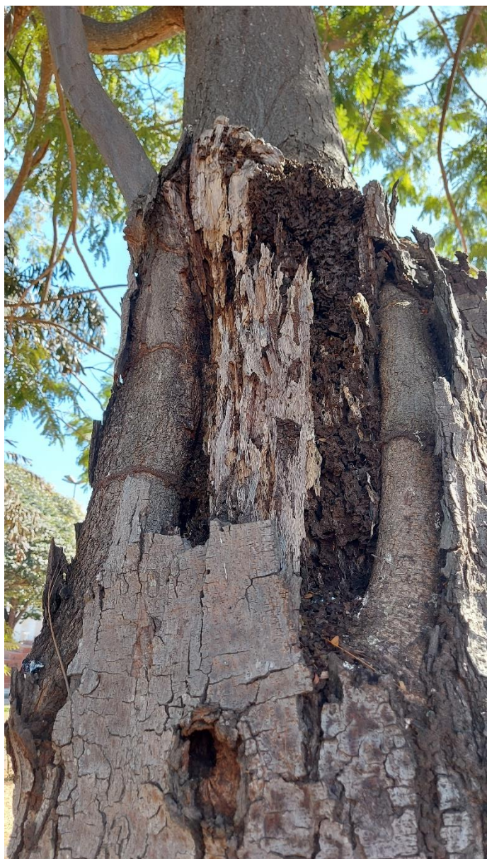
Fotos 05 e 06: Canafístula em declínio, apresentando considerável risco de queda e que necessita ser suprimida!