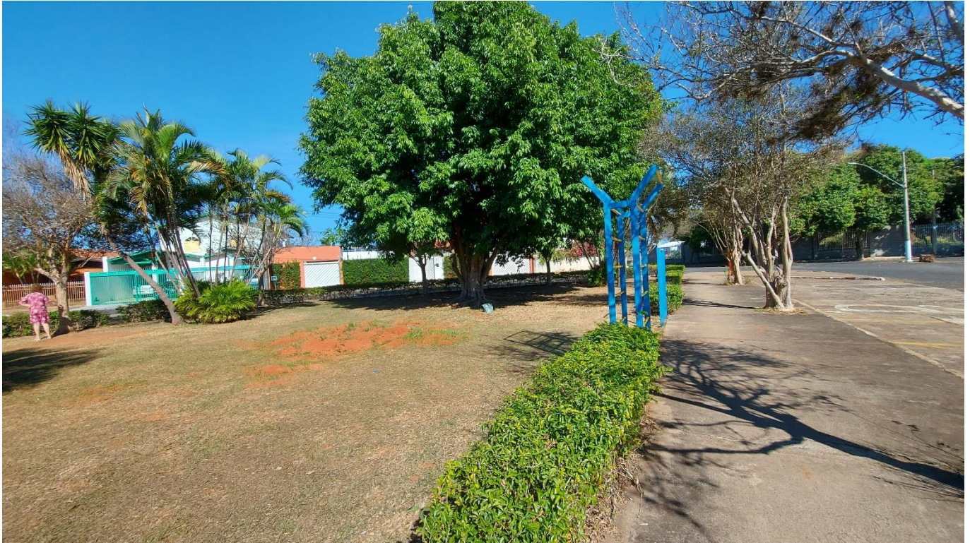
Foto 07: Praça com considerável incidência de formigas; necessário o combate e monitoramento