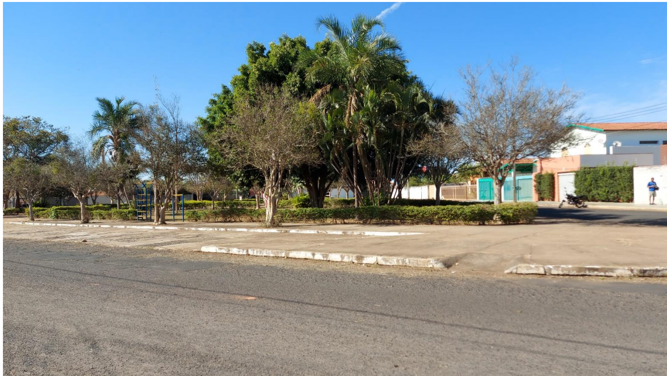
Foto 01: Vista geral da Praça Padre Elói, no bairro Jardim Regina