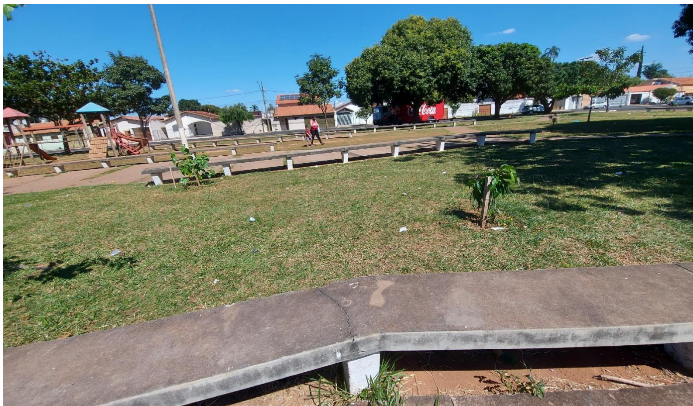
Foto 09: Vista geral da parte posterior da Praça Augusto Diniz: indivíduos arbóreos saudáveis e com espaçamentos de plantio adequados