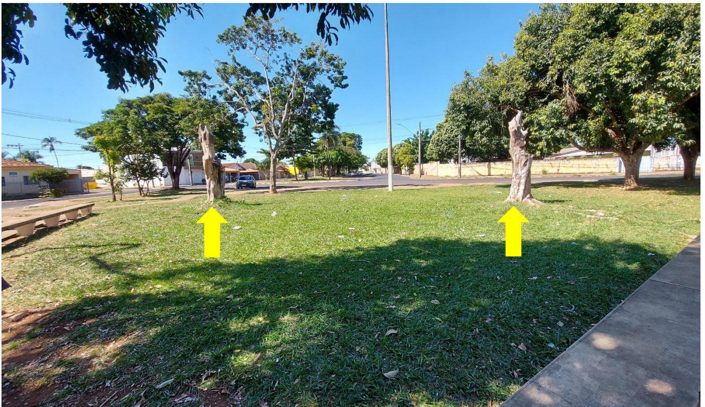
Foto 15: Dois troncos de Ficus mortos na parte posterior da Praça Augusto Diniz, para os quais recomenda-se suas retiradas e substituição por árvores de porte adequado ao espaço público