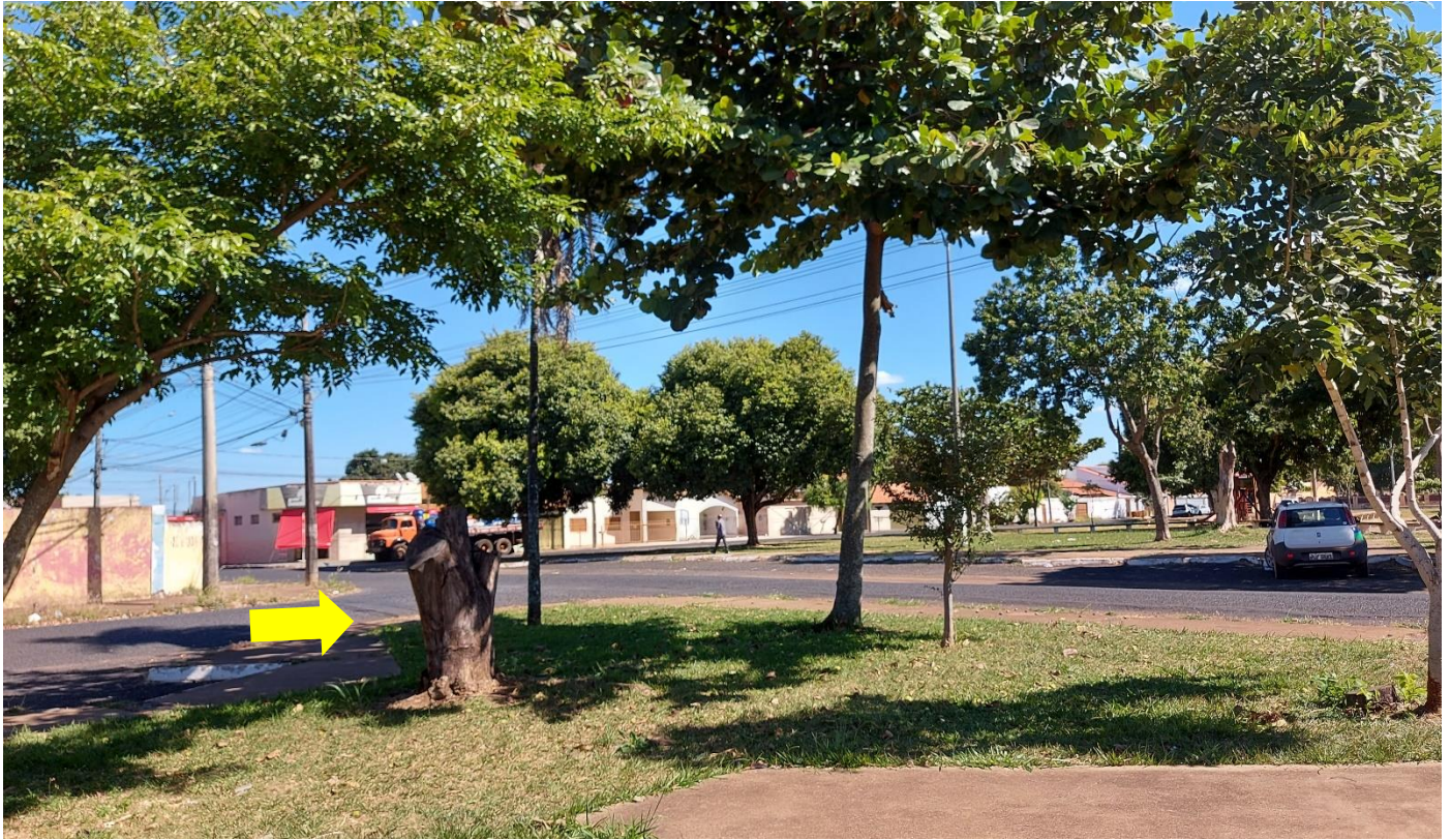
Foto 16: Troncos de árvore morta não identificada na parte anterior da Praça Augusto Diniz, para o qual recomenda-se sua retirada e substituição por árvore de porte adequado ao espaço público