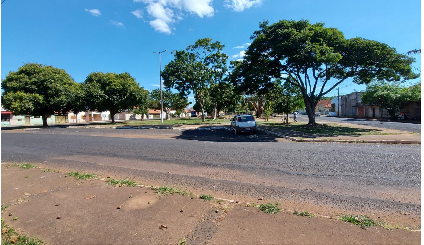
Foto 01: Vista geral da parte posterior da Praça Augusto Diniz, no Bairro de Fátima