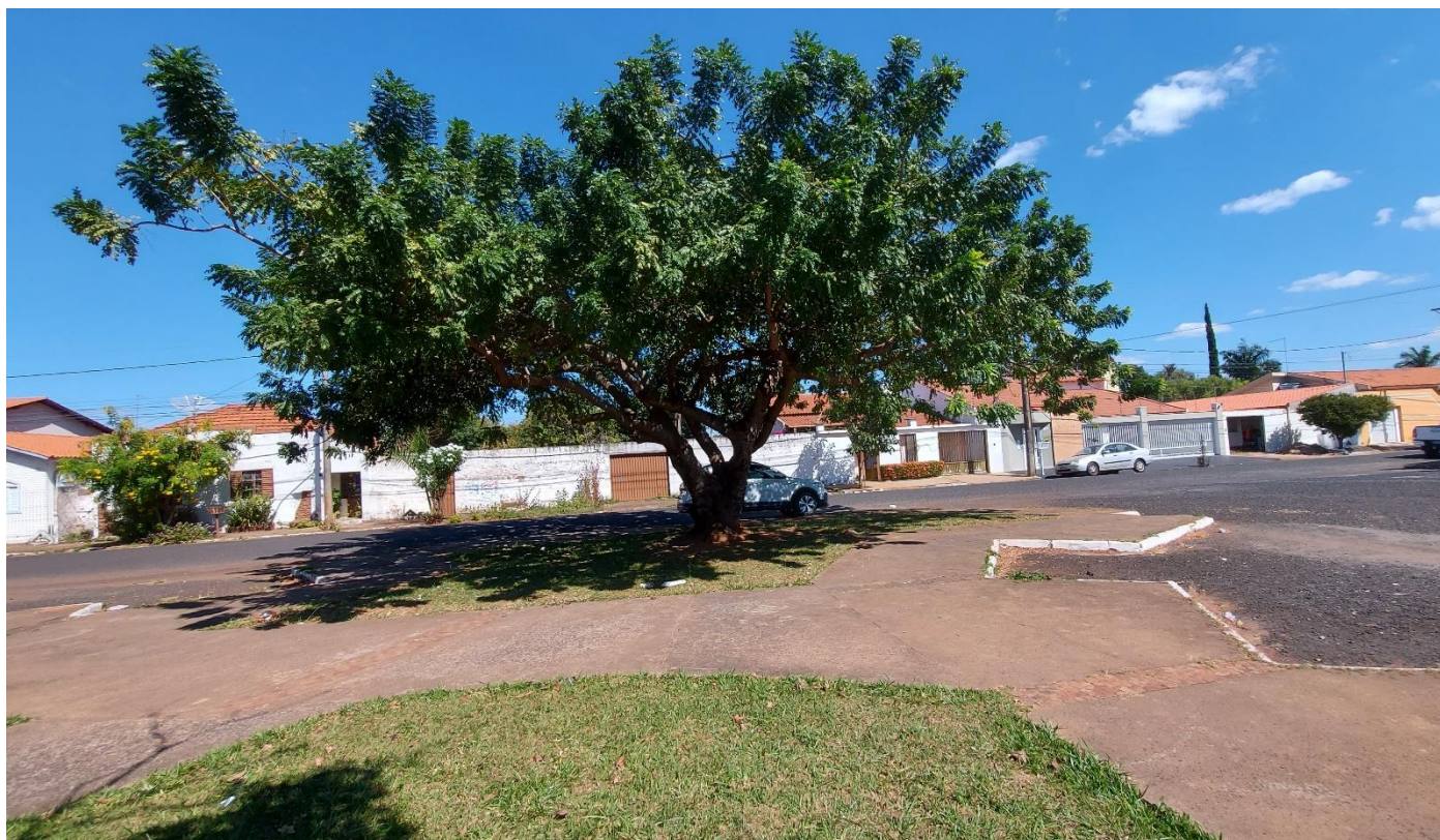
Fotos 13: Vista geral da parte posterior da Praça Augusto Diniz: indivíduos arbóreos saudáveis e com espaçamentos de plantio adequados