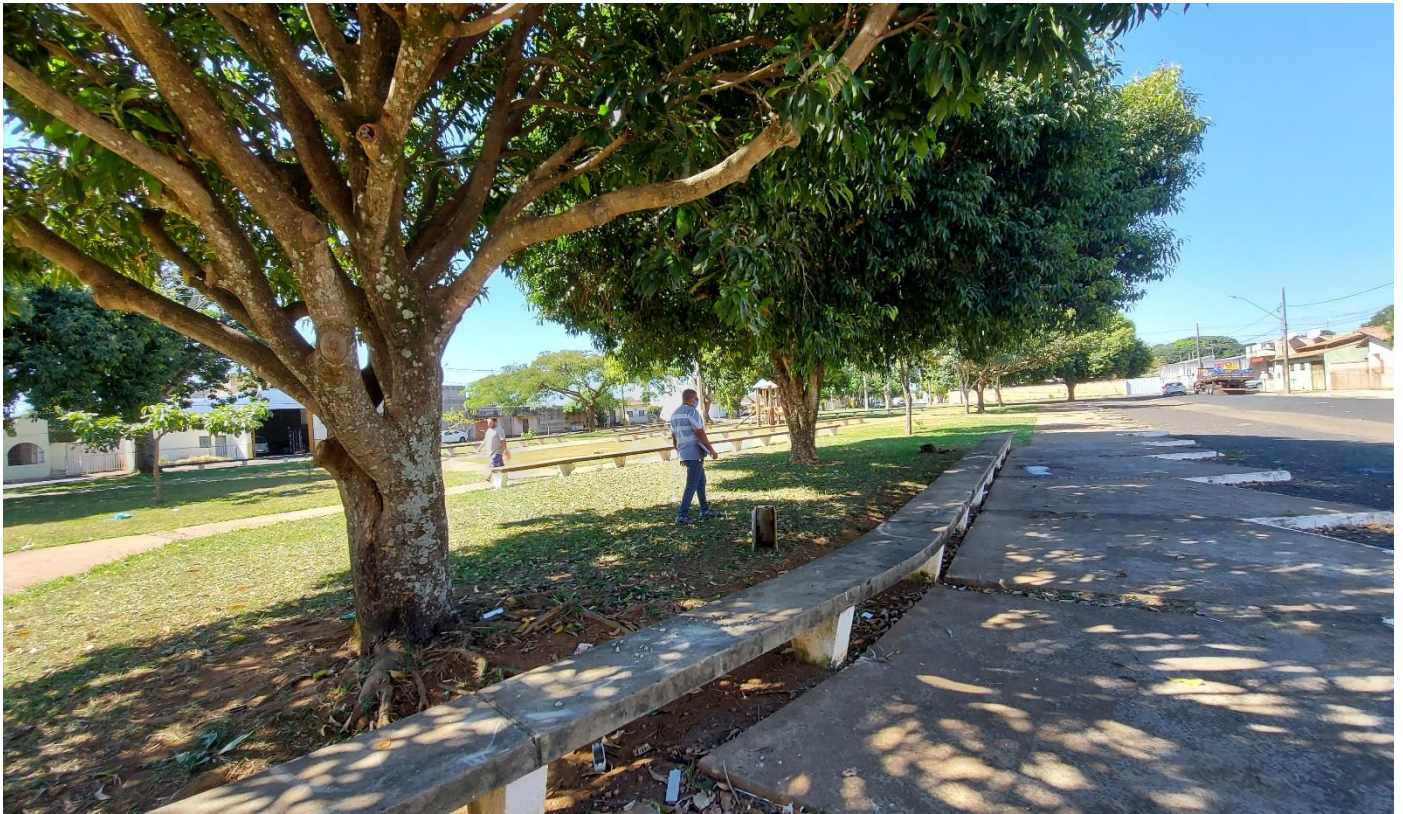
Fotos 14: Vista geral da parte posterior da Praça Augusto Diniz: indivíduos arbóreos saudáveis e com espaçamentos de plantio adequados