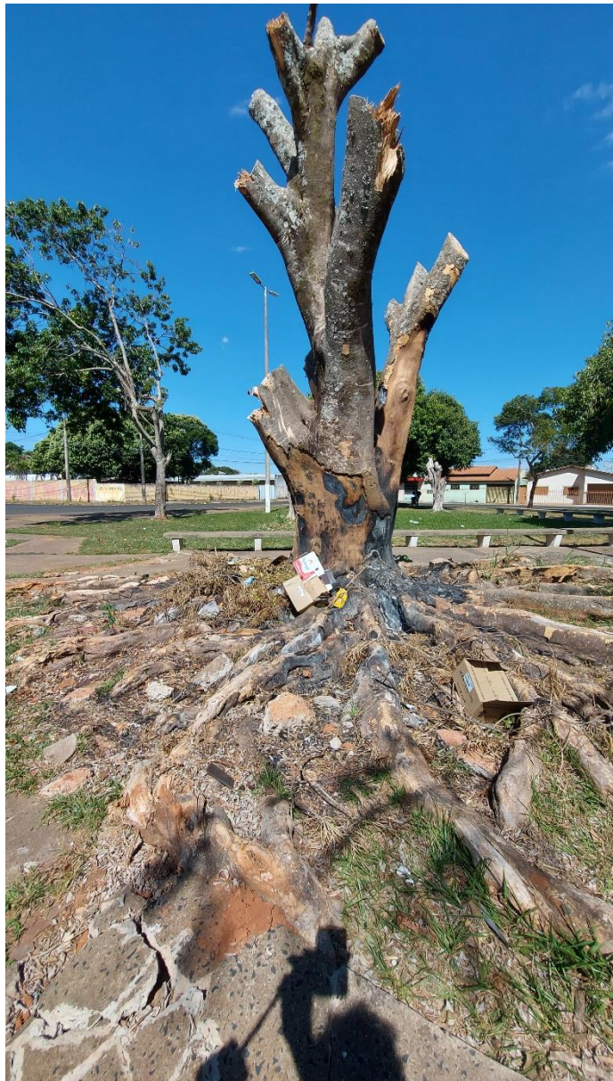
Fotos 05 e 06: Abacateiro e tronco de Ficus (para o qual recomenda-se retirada) na parte posterior da Praça Augusto Diniz