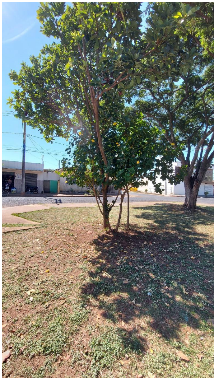
Fotos 03 e 04: Sibipiruna e Abacateiro (para o qual recomenda-se a poda drástica) na parte posterior da Praça Augusto Diniz