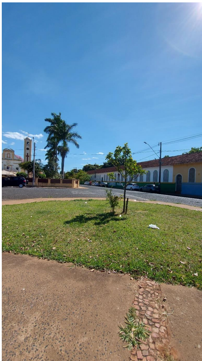
Fotos 10 e 11: Vista geral da parte posterior da Praça Augusto Diniz: indivíduos arbóreos saudáveis e com espaçamentos de plantio adequados