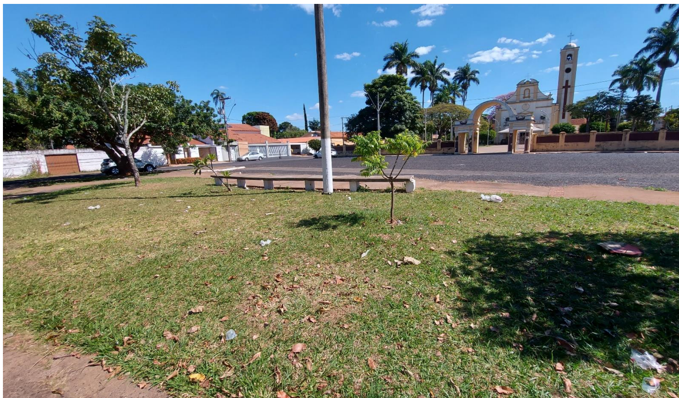
Fotos 12: Vista geral da parte posterior da Praça Augusto Diniz: indivíduos arbóreos saudáveis e com espaçamentos de plantio adequados