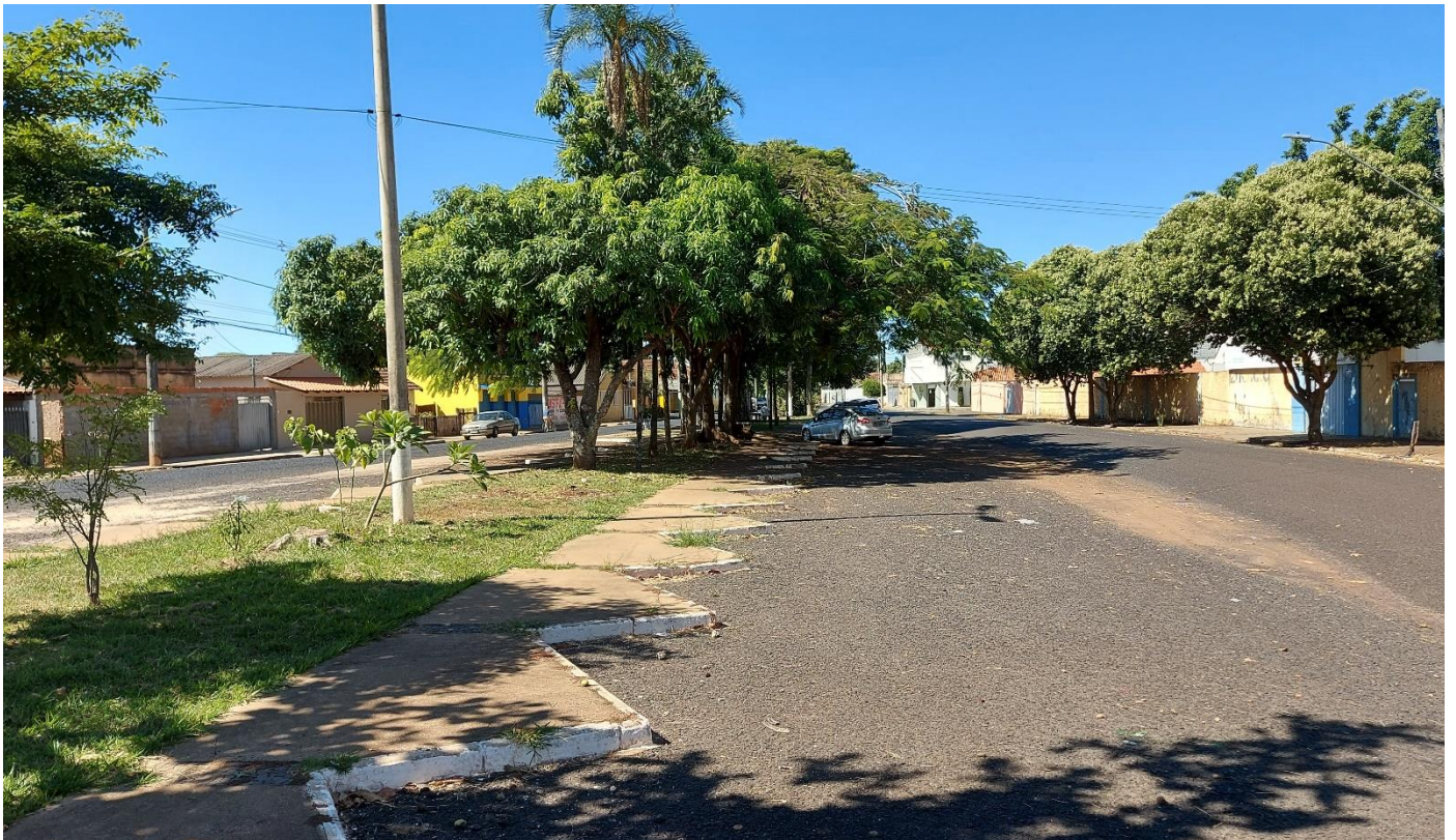
Foto 02: Vista geral da parte anterior da Praça Augusto Diniz, no Bairro de Fátima