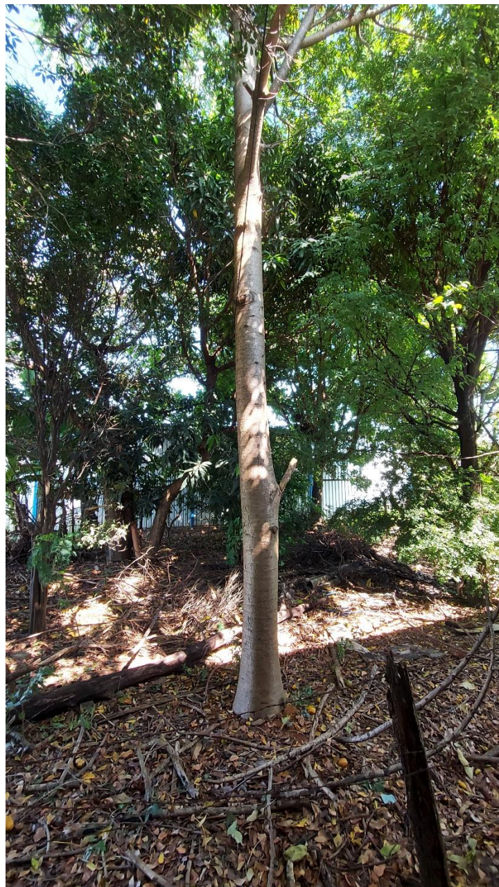
Fotos 03 e 04: Ingazeiro e Abacateiro plantados irregularmente em área de hangares no Aeroporto Municipal de Araguari