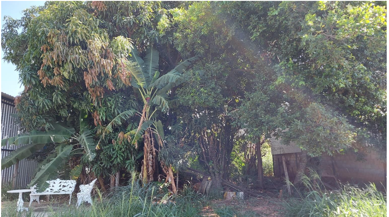
Foto 01: Vista geral do “pomar” plantado irregularmente em área de hangares no Aeroporto Municipal de Araguari