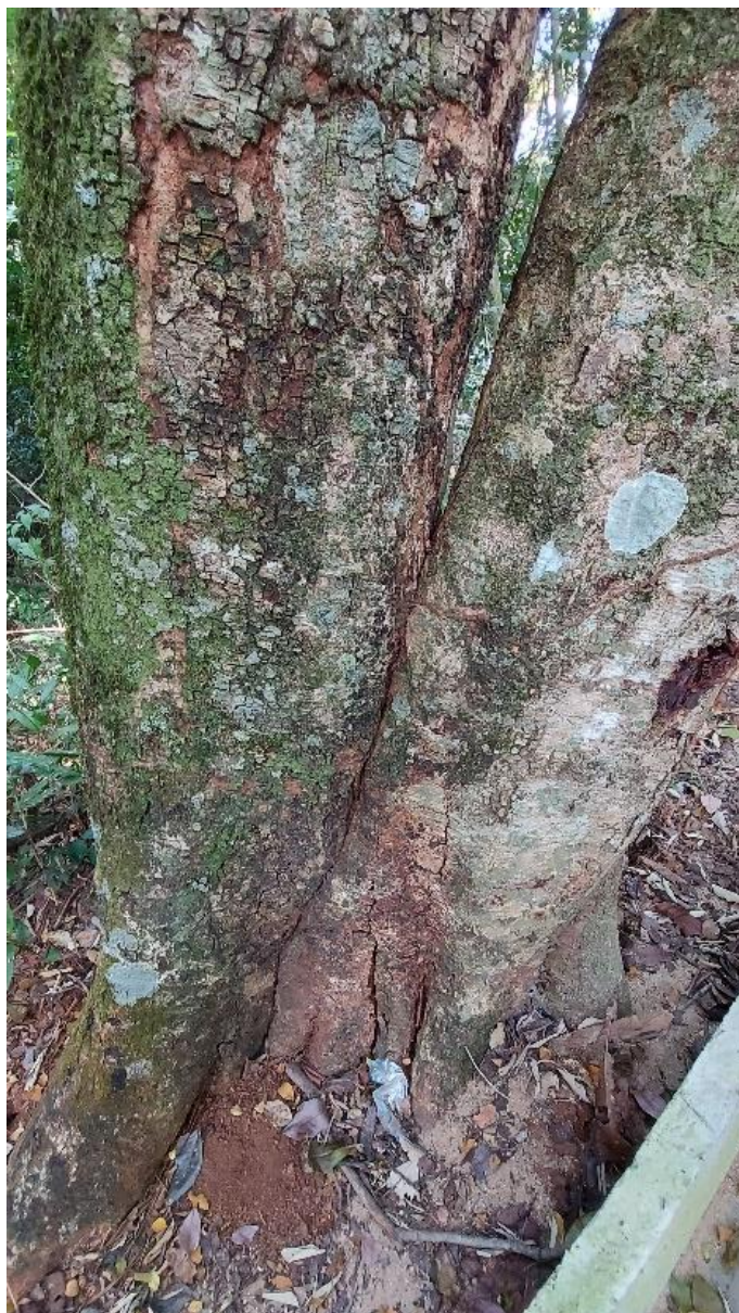
Foto 08: Estrutura de sustentação do Ingazeiro: a retirada de apenas um dos ramos pode comprometer toda a estrutura da árvore