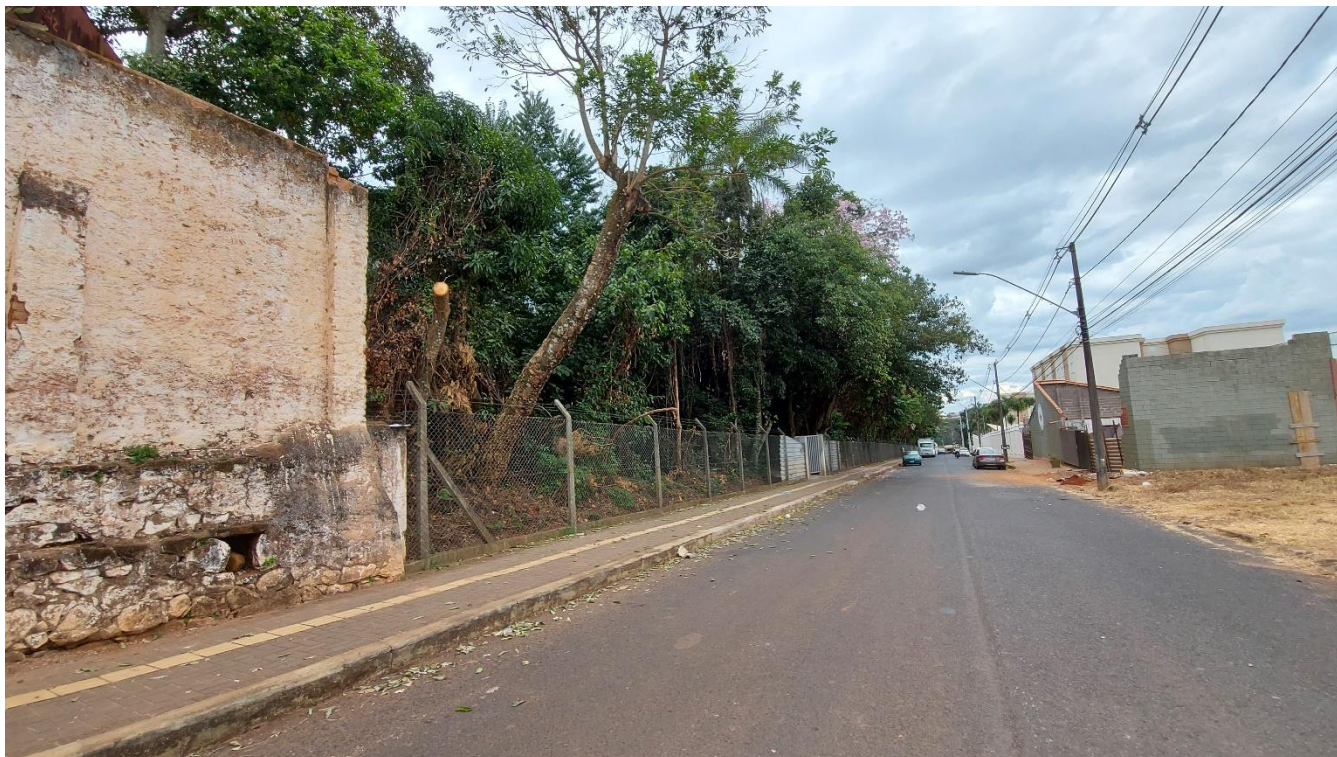
Foto 01: vista geral do trecho na Rua Argentina, onde a árvore vistoriada se encontra