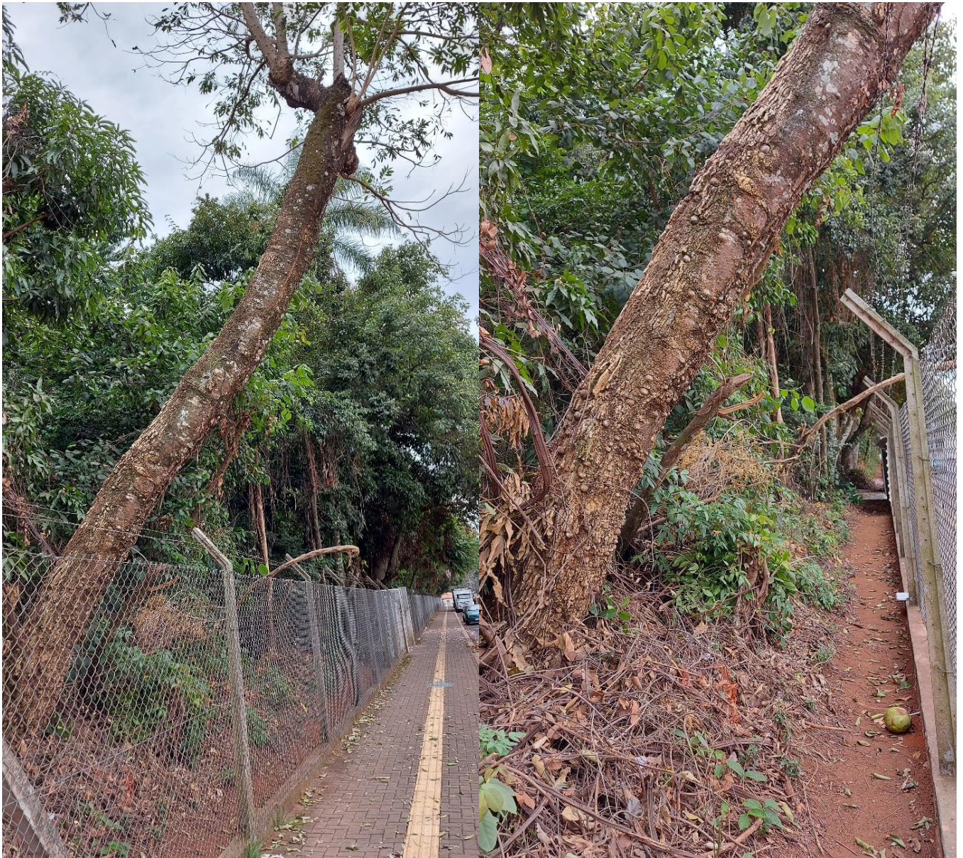
Foto 03 e 04: Detalhe da árvore vistoriada: tronco bastante inclinado, oferecendo considerável risco de queda