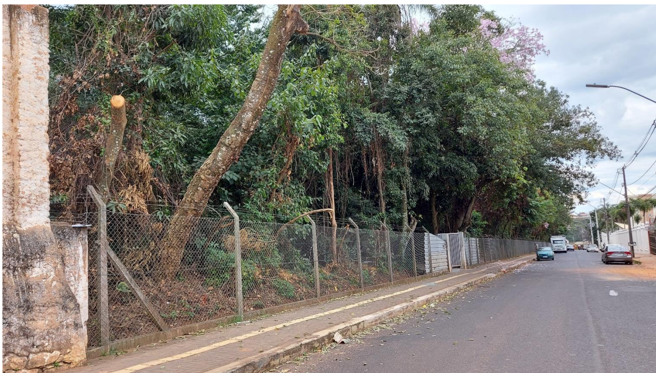
Foto 02: vista geral do trecho na Rua Argentina, onde a árvore vistoriada se encontra