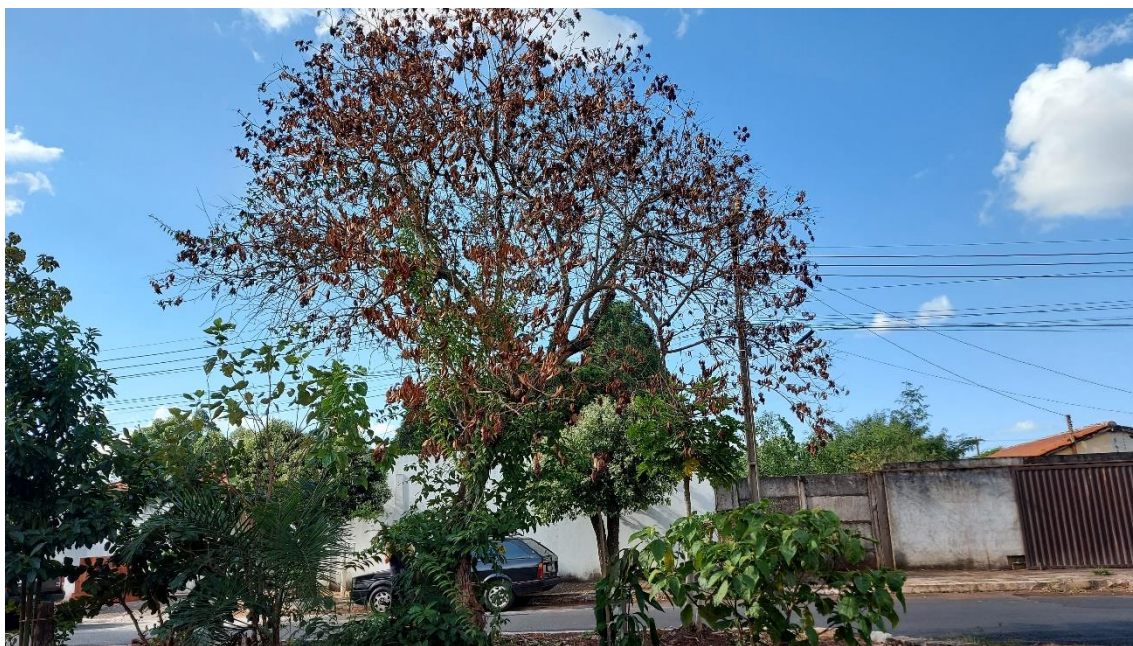
Foto 02: Alfeneiro em declínio, no canteiro da Avenida das Codornas