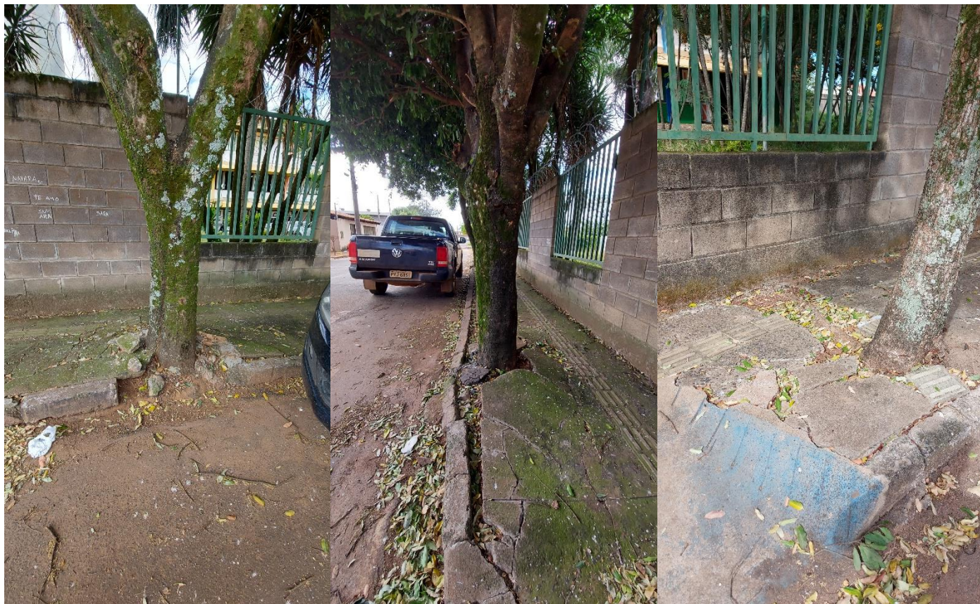
Fotos 01, 02 e 03: Oitis em passeio em frente à escola; solicita-se a poda por estarem danificando o calçamento