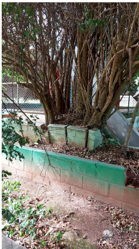
Fotos 08 e 09: Leucena e Primavera em canteiro lateral à quadra, com raízes causando danos às estruturas