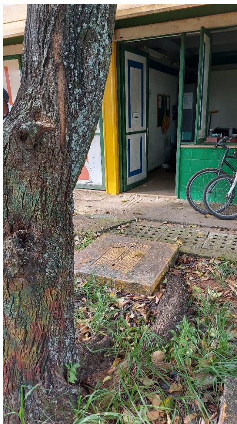
Fotos 06 e 07: Alfeneiro em canteiro interno; raízes causando danos ao calçamento e confrontando com base de rede elétrica