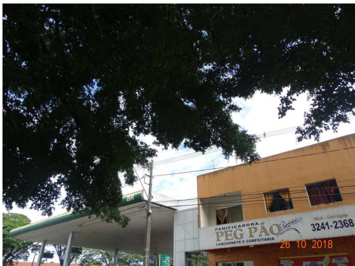
Figura 01 – Copa das Ficus.