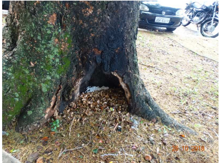
Figura 06- Base da Albisia com ferida.

Parecer técnico: Conforme vistoria in loco foram identificados seis indivíduos arbóreos no interior da praça, sendo cinco Ficus com o sistema radicular exposto, no entanto, estão saudáveis e uma Albisia com ferida devido à ação do fogo. As árvores estão com galhos direcionados à via pública, recomenda-se a poda desses galhos e supressão da Albisia .