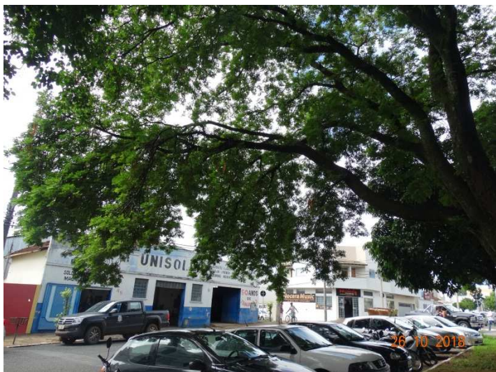
Figura 03- Galho da Albisia para via pública.