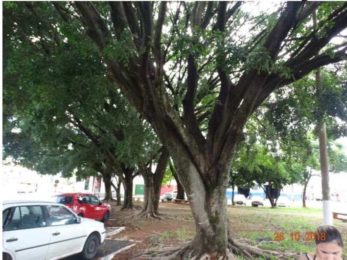
Figura 05- Vista geral das Ficus.