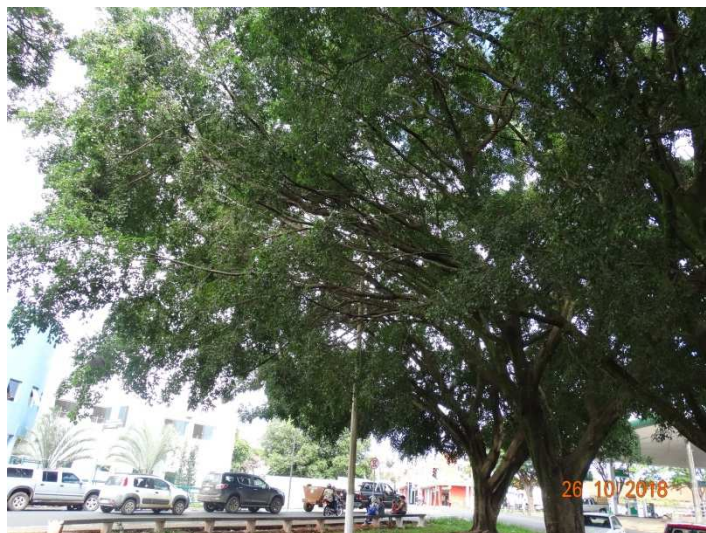
Figura 04 - Galho das Ficus para via pública.