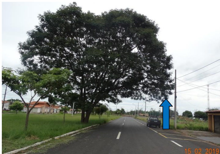
Figura 01 – Farinha seca.